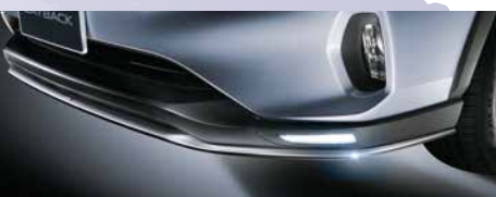
フロントアンダースポイラー

SUBARU純正アクセサリです。 LAYBACKアクセサリカタログをご覧ください。