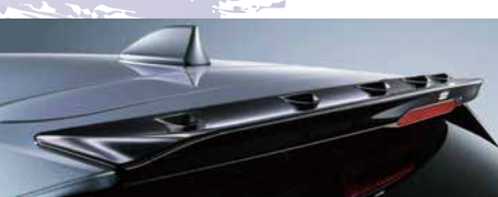
ルーフエンドスポイラー

※写真はイメージです。実際の商品と異なる場合があります。 実際の商品取付けは取付取扱説明書に従って取付けてください。 ※表示価格は標準工賃(必要な場合)と消費税10%を含むメーカー希望小売価格。 併記の[]は消費税抜の[メーカー希望本体価格+税標準工賃]です。 工賃別商品の工賃は販売店にお問い合わせください。 尚、新車装着時以外で装着する場合は、作業内容に応じ別途追加工賃がかかる場合がございます。 詳しくは販売店にお問い合わせください。