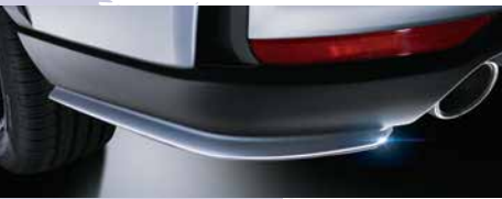
リアサイドアンダースポイラー