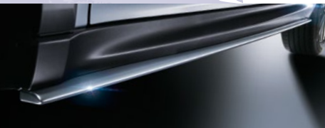
サイドアンダースポイラー